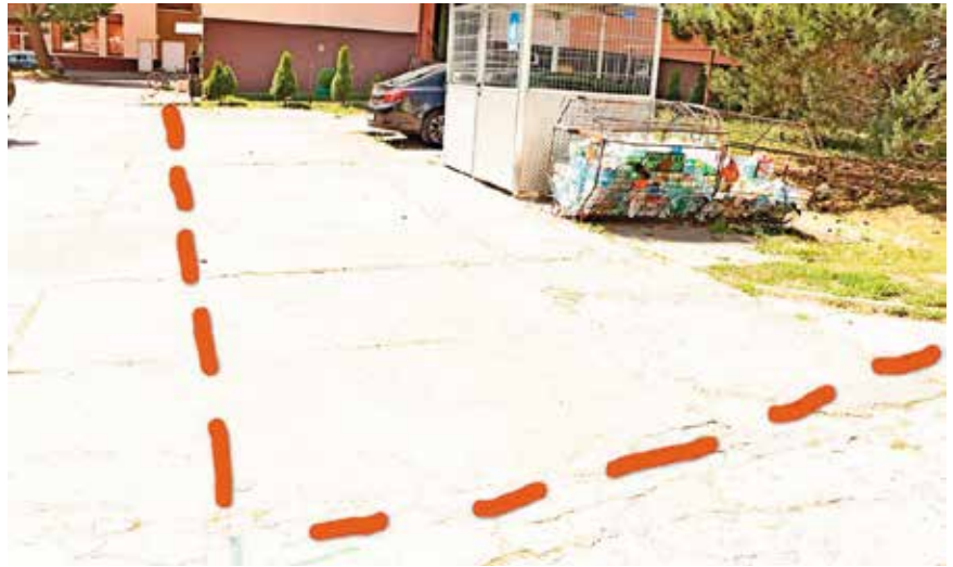
Kolorem czerwonym oznaczono teren, którego właścicielem jest Powiat Goleniowski