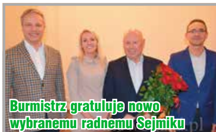
Burmistrz gratuluje nowo wybranemu radnemu Sejmiku