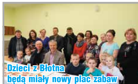
Dzieci z Błotna będą miały nowy plac zabaw