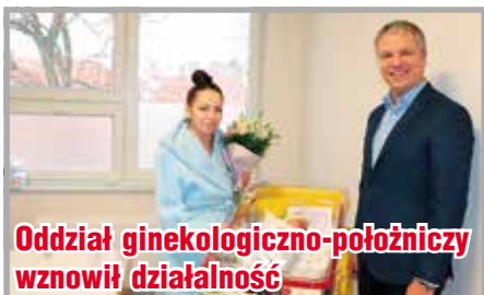
Oddział ginekologiczno-położniczy wznowił działalność