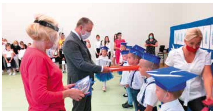
Nowogardzkie szkoły gotowe do prowadzenia lekcji w reżimie sanitaryjnym