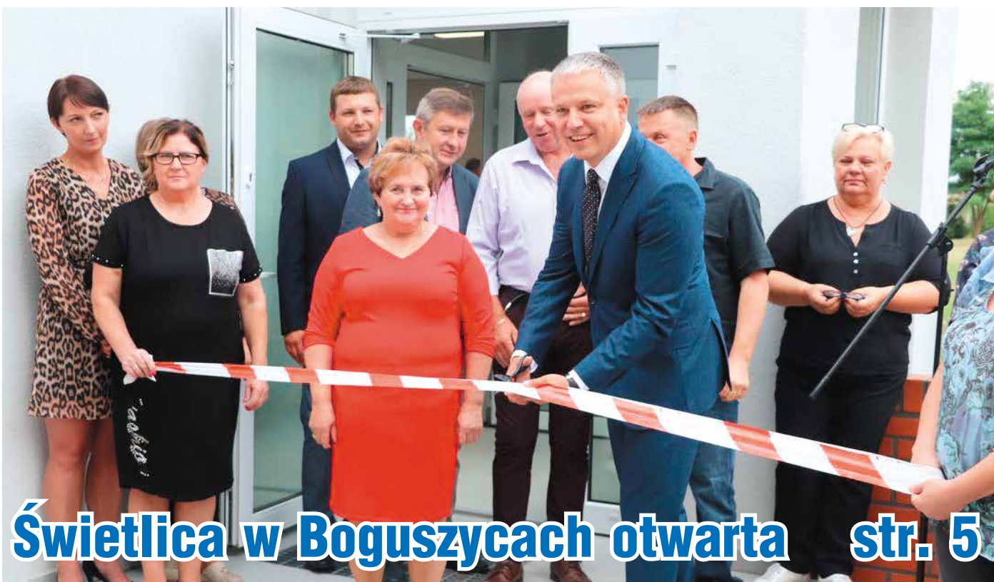
Świetlica w Boguszcach otwarta str. 5