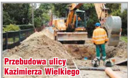
Przebudowa ulicy Kazimierza Wielkiego