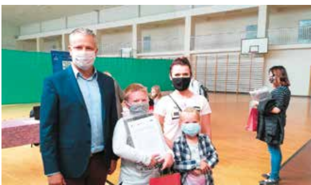
Przekazano uczniom laptopy teraz nauka będzie łatwiejsza