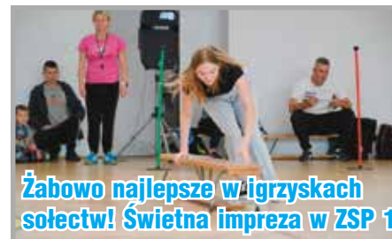
Żabowo najlepsze w igrzyskach sołectw! Świetna impreza w ZSP 1