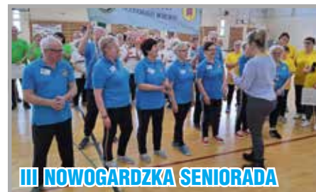
III NOWOGARDZKA SENIORADA