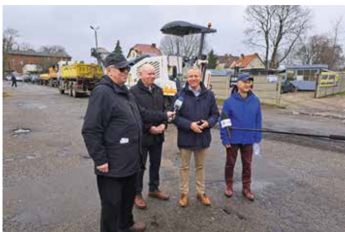
Ruszyła przebudowa łącznika przy dworcu