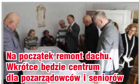
Na początek remont dachu. Wkrótce będzie centrum dla pozarządowców i seniorów