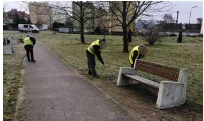
Hakanie i grabienie liści ścieżki i terenów zielonych przy siłowni przy ul. Ludwika Waryńskiego