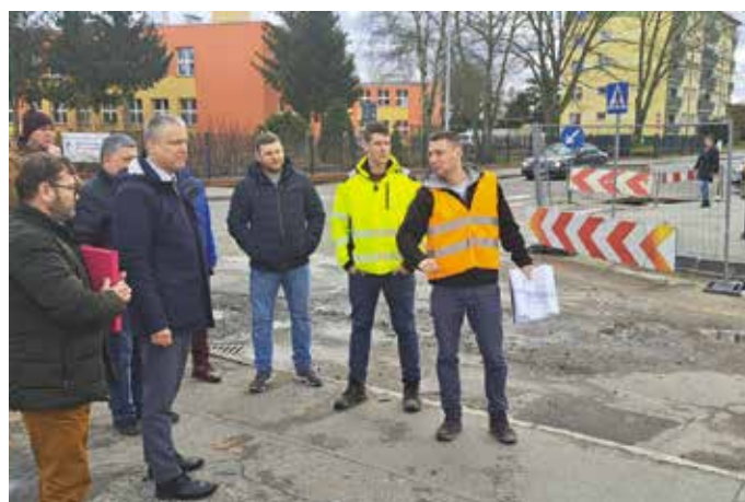
Ulica Żeromskiego będzie jak nowa