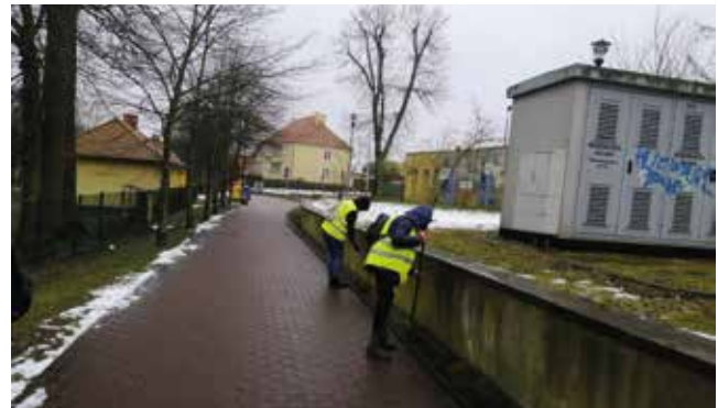
Hakanie i sprzątnięcie ścieżki pieszo-rowerowej - ul. Promenady