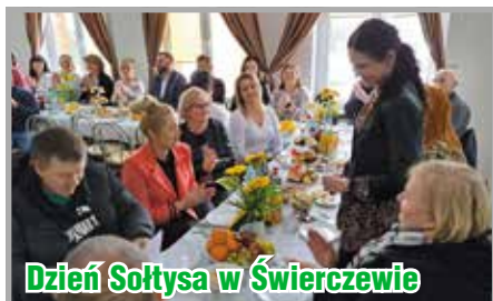
Dzień Sołtysa w Świerczewie