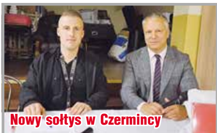
Nowy sołtys w Czerminicy