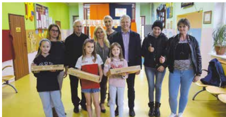
Laptopy dla uczniów klas czwartych