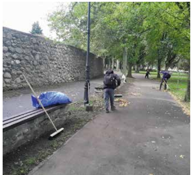
Zamiatanie ścieżki pieszo-rowerowej przy murach