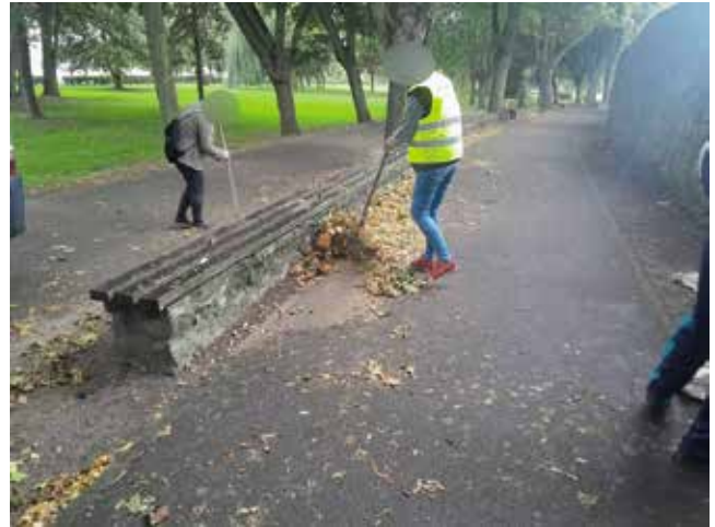
Zamiatanie ścieżek pieszo-rowerowych