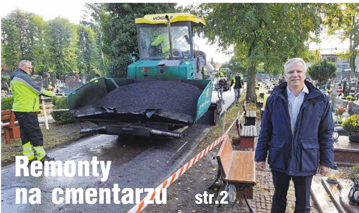
Remonty na cmentarzu str.2