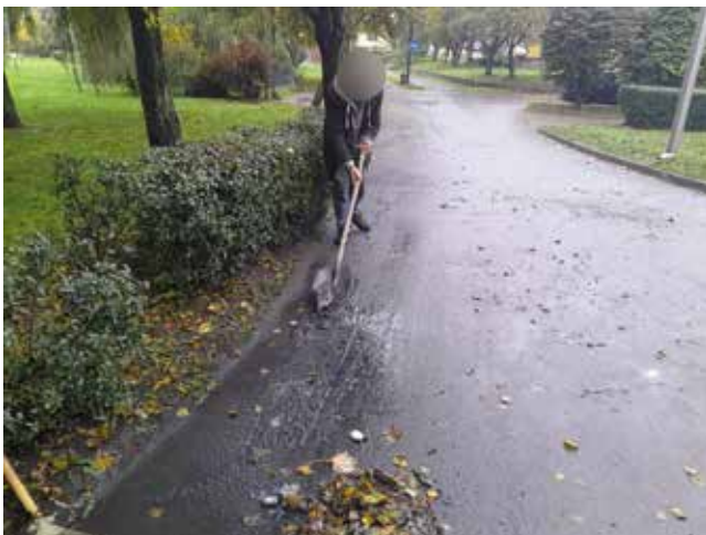
Czyszczenie drogi po ulewach na ul. Zielonej