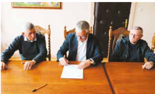
Burmistrz podpisał kolejne umowy na wymianę „kopciuchów”