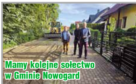
Mamy kolejne sołectwo w Gminie Nowogard