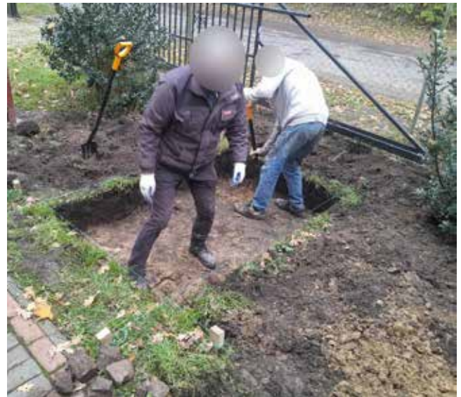
Przygotowanie terenu pod montaż pieca chelbowego przy świetlicy w Długoleście