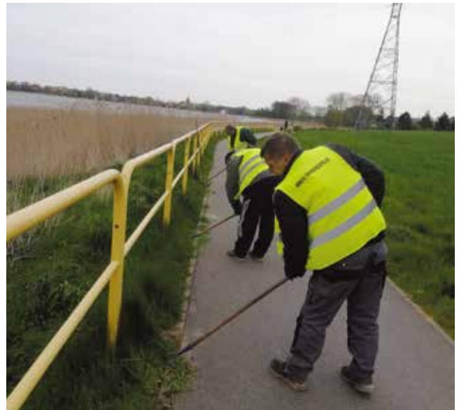
Zamiatanie ścieżki i koszenie pobocza