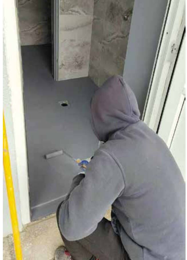
Malowanie posadzki betonowej w szatni na stadionie miejskim