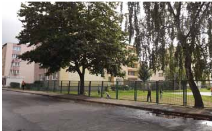
Parking Żeromskiego przed remontem

Pod koniec ubiegłego roku, zakończono prace budowlane polegające na budowie nowych miejsc parkingowych przy Szkole Podstawowej Nr 2 w Nowogardzie.