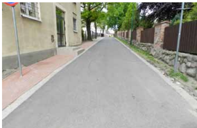
Ulica Szkolna po remoncie