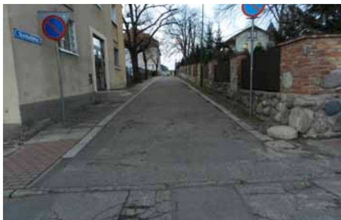
Ulica Szkolna przed remontem