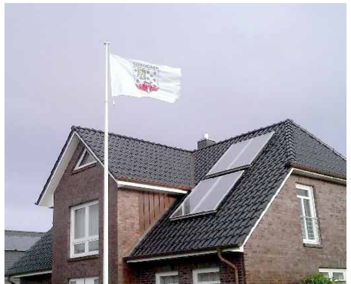
Flaga z herbem Nowogardu na jednej z ulic Heide