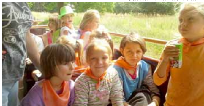
Szkoła Podstawowa nr 2