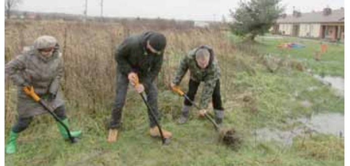
2014 - wbicie pierwszej łopaty