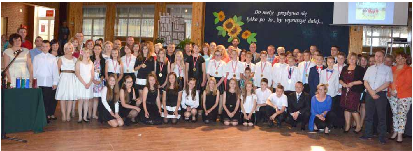
Sześcioklasiści - ostatnie wspólne zdjęcie