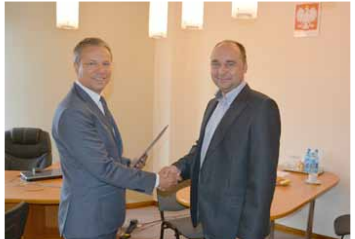
Przejęcie obowiązków Burmistrza Nowogardu

Ostatnimi punktami dnia była wizyta w Zakładzie Karnym w Nowogardzie oraz spacer nad jeziorem, podczas którego zastępujący burmistrz stwierdził, iż w ostatnich latach dużo się zmieniło w Nowogardzie, a samo centrum bardzo zyskało na estetyce.