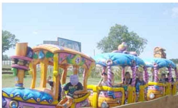
Szkoła Podstawowa nr 1