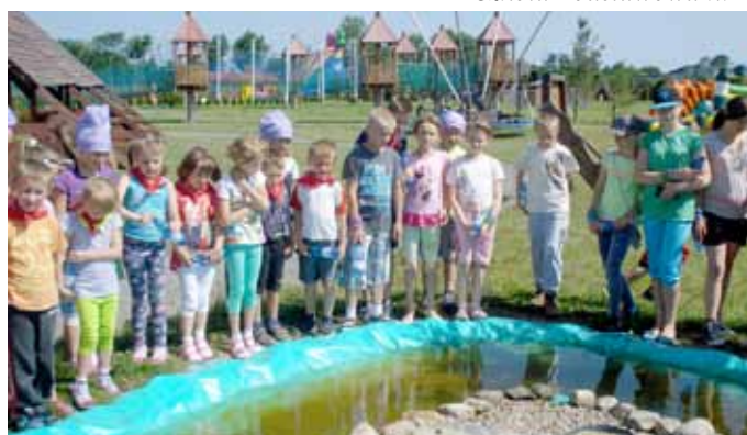
Szkoła Podstawowa nr 1