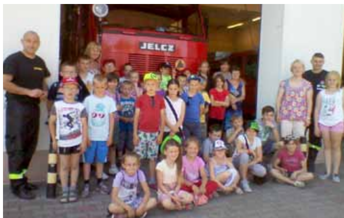
Szkoła Podstawowa nr 2

Dnia 07 lipca 2015 uczestnicy Półkolonii mieli zorganizowaną wycieczkę jednodniową do Bałtyckiego Parku Dinozaurów we Wrzosowie. Przed wyjazdem została przeprowadzona pogadanka dotyczące bezpiecznego zachowania podczas podróży autokarem.