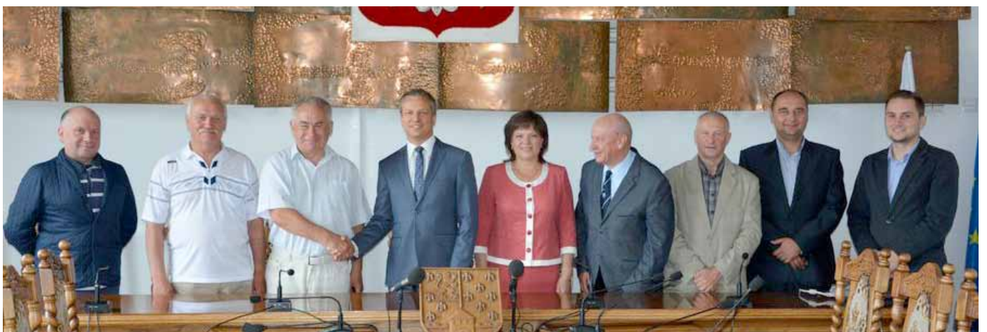
Sala Rady Miejskiej w Nowogardzie - z delegacją miast okręgu Kalingradzkiego (Rosja)