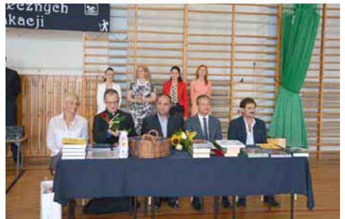
Zakończenie Roku Szkolnego w SP I

Na pytania mediów odnośnie przebiegu jej wizyty odpowiedział: „Moja wizyta była bardzo pozytywna. Poznałem wiele