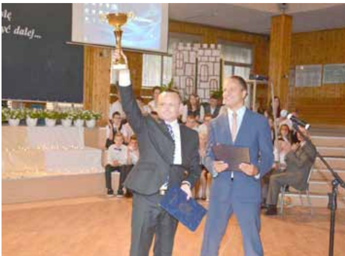
Wręczenie przez burmistrza dyrektorowi szkoły nagrody za I miejsce w sportowej rywalizacji międzyszkolnej w kategorii Szkół Podstawowych