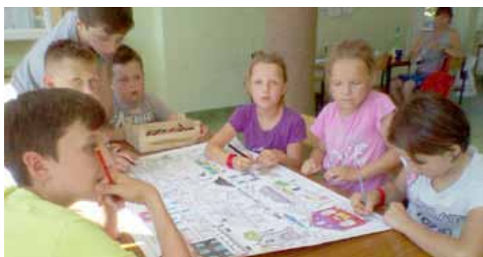
Szkoła Podstawowa nr 2