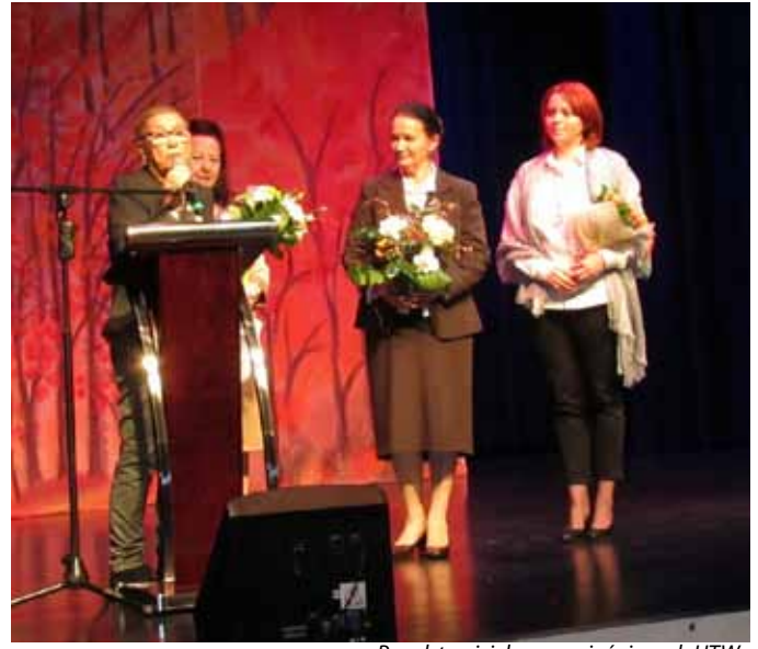
Przedstawiciele zaprzyjaźnionych UTW