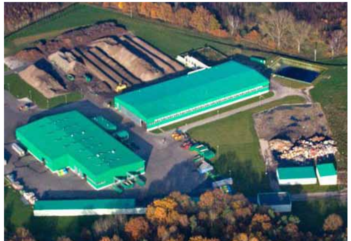
Regionalny Zakład Gospodarowania Odpadami w Słajsinie