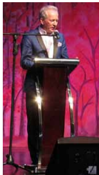
Sławomir Preiss, Senator RP