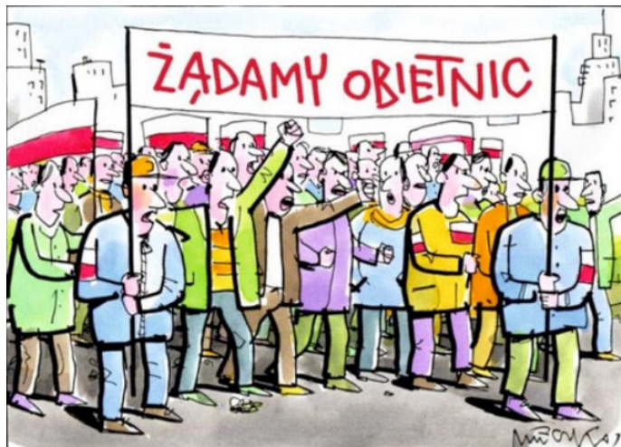
rysunek ze strony: http://leszek-moje-reflesje-blog-onet.blogspot.com